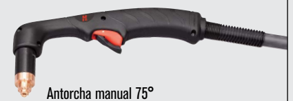
Antorcha manual 75°

(visitar www.hypertherm.com para más opciones de antorchas)