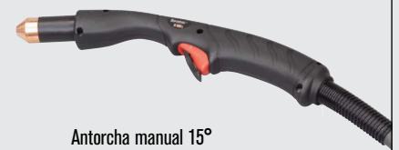
Antorcha manual 15°