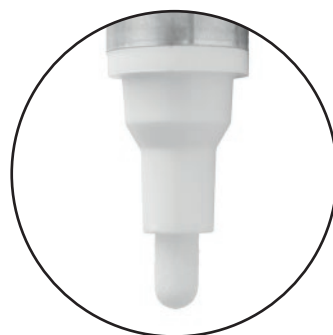
Punta de 1/8" (3 mm)

Precaución: Nocivo o fatal si se traga. Inflamable. Usar en área bien ventilada. MANTENER FUERA DEL ALCANCE DE LOS NIÑOS. SÓLO PARA USO INDUSTRIAL