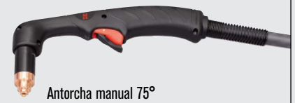
Antorcha manual 75°

(visitar www.hypertherm.com para más opciones de antorchas)